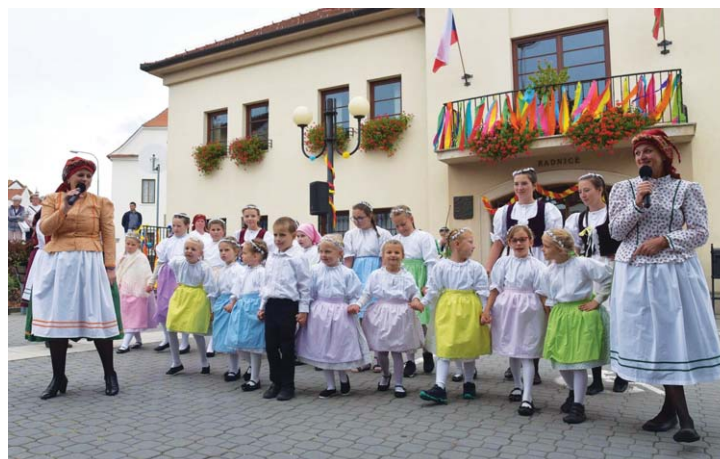
Dětský folklorní kroužek – Hody