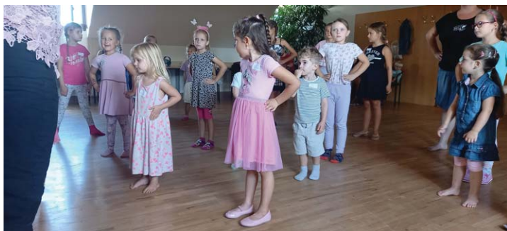
Dětský folklorní kroužek – Nábor