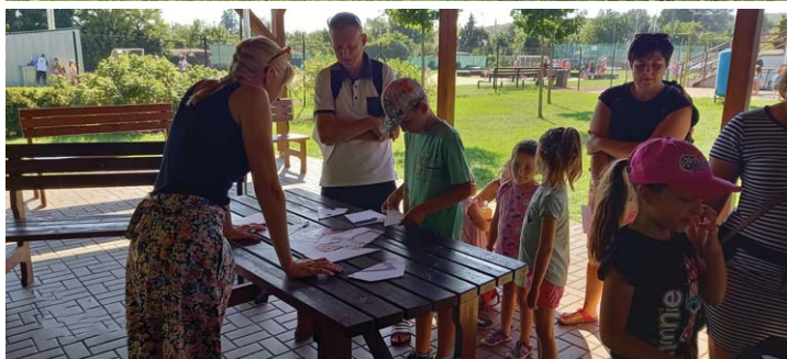
Dětský folklorní kroužek – Kroužkobraní