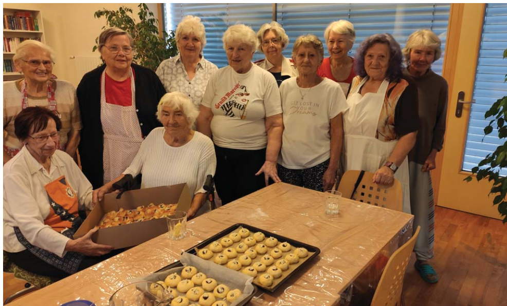
Tým našich zkušených pekařek, které vždy připravují dobroty