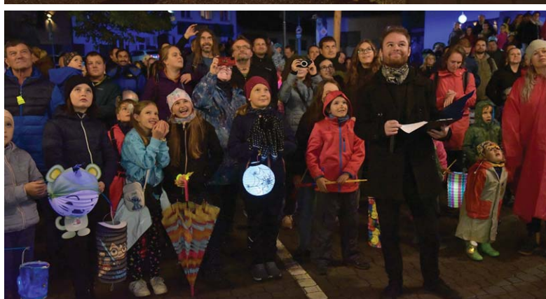
Další foto na mirekhajek.rajce.idnes.cz