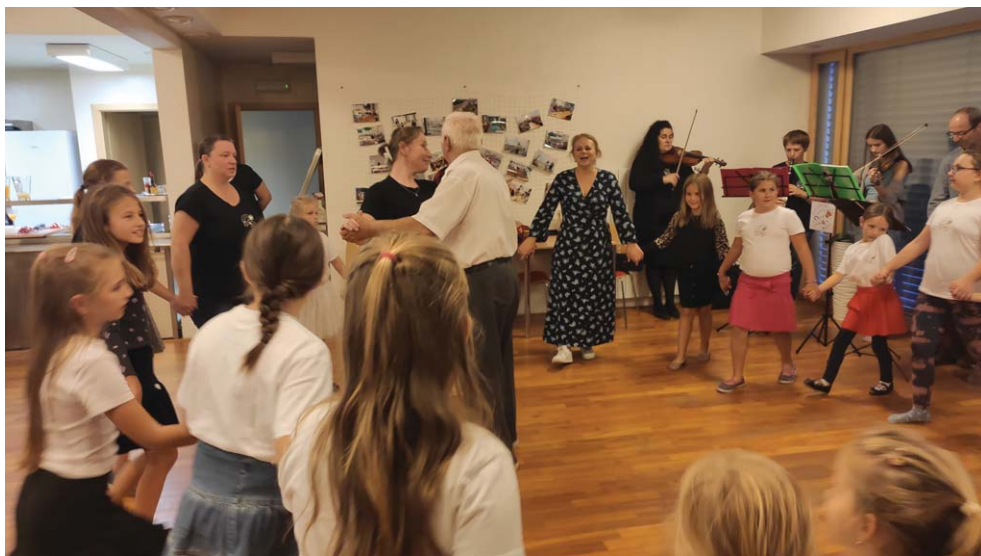
Pohodové „PO HODOVÉ“ vystoupení Folklorního kroužku a oslavy životních jubileí