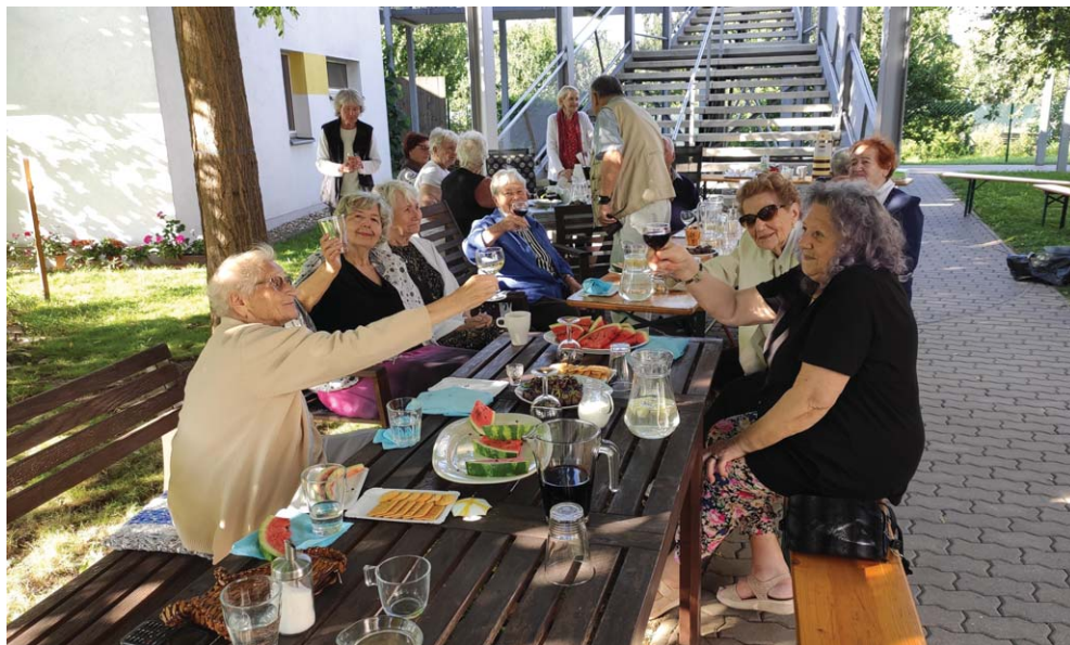
Zábavná odpoledne s hudební skupinou JEN TAK Band