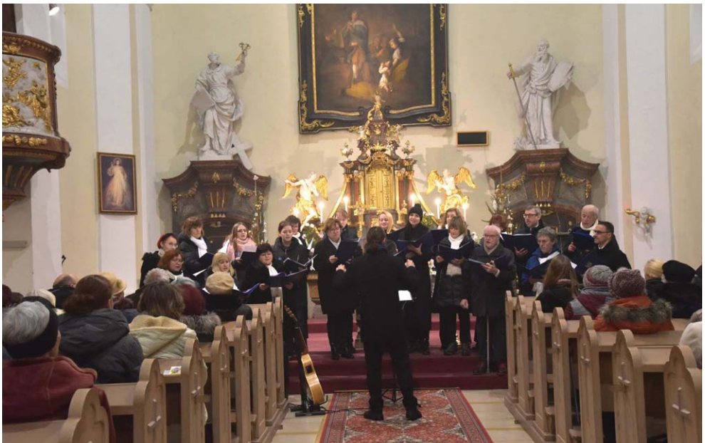
Zpívání u jesliček

V červnu jsme přispěli k programu Noci kostelů v Modřicích ukázkou, jak probíhá nácvik repertoáru sboru, někteří návštěvníci