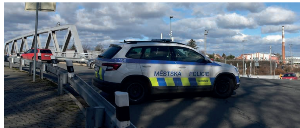
Ilustrační foto M.Hájek

Za MP Modřice: Lukáš Krakowczyk, vrchní komisař