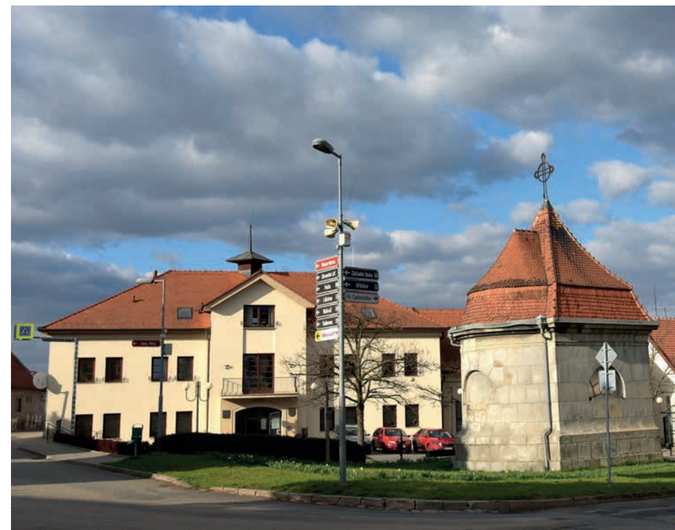
Ilustrační foto M. Hájek

Usnesení 11R-6.19/2023: RMM schvaluje bezúplatný pronájem pozemku pro umístění pouťových atrakcí v termínu od 02. 05.– 09. 05. 2023 Heleně Šimkové, Vlasatice 8, IČ 08993785.