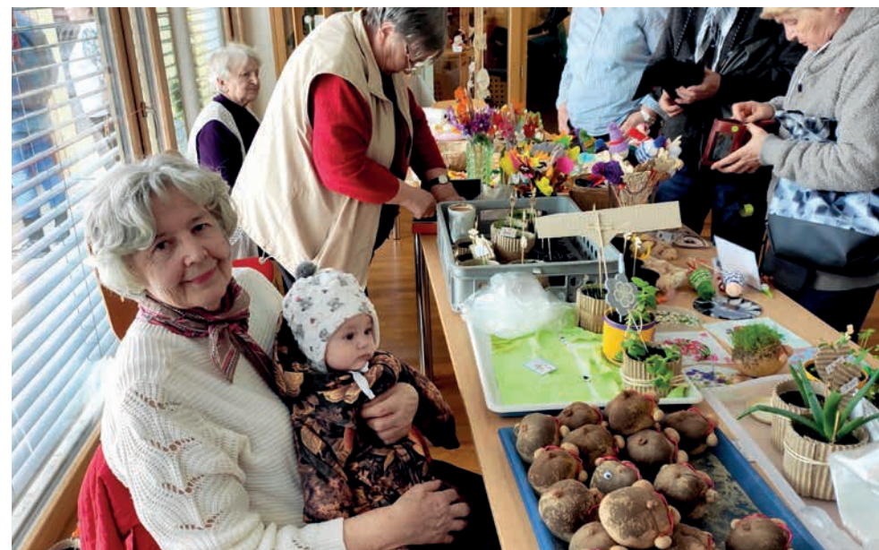
Příležitost k propojení moudrosti s dětskou čistotou