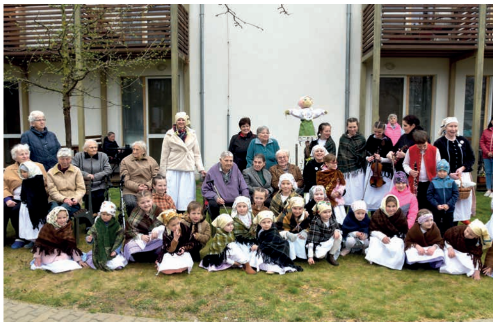
Ve společnosti dětí pookříváme