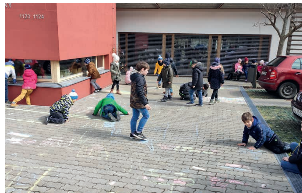
Děti z družiny ZŠ Modřice prokázaly svůj výtvarný talent s křídou na chodníku a mohly si odnést z jarmarkové dílničky svůj výtvar a balónek