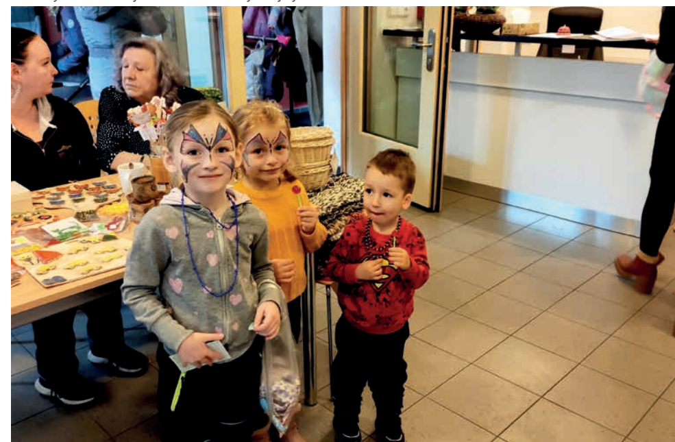
Nenjen dospělí, ale i malí návštěvníci Jarního jarmarku v PBDS prožili krásné odpoledne