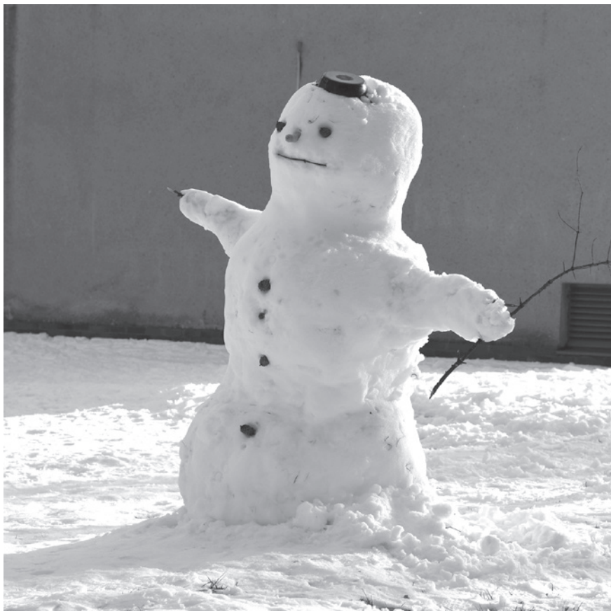
Zimní tvorba pro radost na ulici Sadová