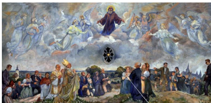
Chrám sv. Gotharda, nástropní malba Poutní zastavení, Rudolf Adámek, 1930

Pouť zahájíme ve 14.00 mší svatou v kostele sv. Gotharda