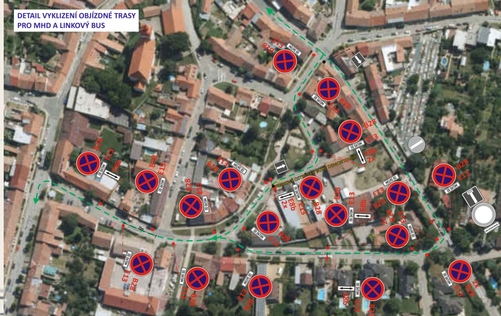
DETAIL VYKLIZENÍ OBJÍZDNÉ TRASY PRO MHD A LINKOVÝ BUS

SITUACE PŘECHODNÉHO DOPRAVNÍHO ZNAČENÍ KOORDINACE STAVEB „MODŘICE, MASARYKOVA-REKONSTRUKCE VODOVODU“ A SIL.III/15278 REKONSTRUKCE KANALIZACE NA UL. MASARYKOVÉ III. etapa - objízdná trasa